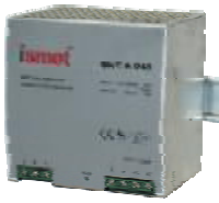
Typ SNT-A 1